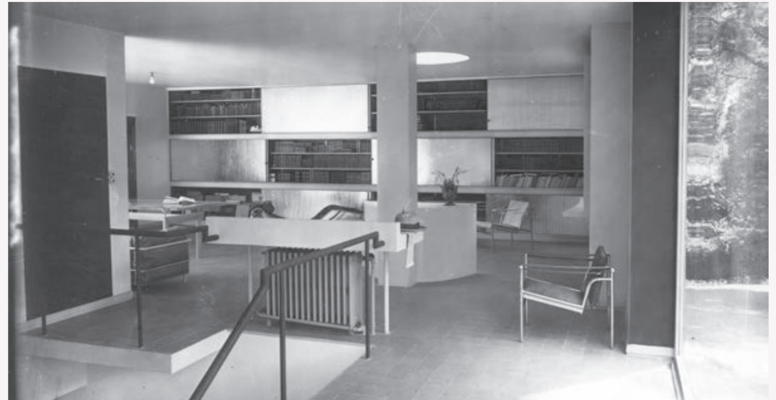
Mobilier de la Villa Church, Ville d'Avray, 1928 © Le Corbusier, Pierre Jeanneret, Charlotte Perriand /ADAGP.